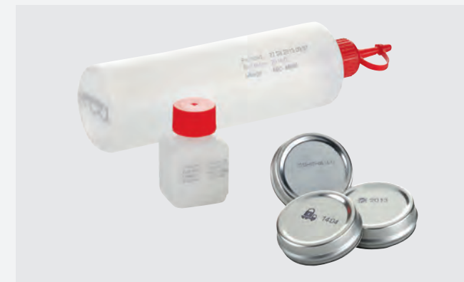
Impresión con tinta de secado rápido sobre metal y plástico (Versión MP).